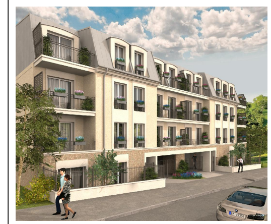
LES JARDINS DE BERLIOZ 10-12 rue des Giroflées 91600 SAVIGNY SUR ORGE